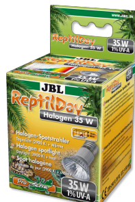
JBL ReptilDay Halogen Halogen-Spotstrahler mit Tageslicht-Vollspektrum