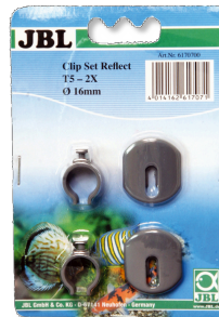
JBL SOLAR REFLECT Clip Set Halterung für Leuchtstoffröhren