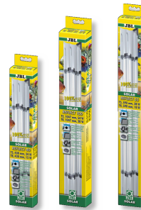
JBL SOLAR Reflect T5/ T8 - 895-1500 mm Reflektorblech für Solar- Leuchtstoffröhre