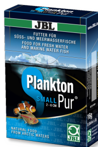
JBL Plankton Pur SMALL Leckerbissen für kleine Aquarienfische