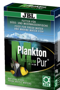
JBL Plankton Pur MEDIUM Leckerbissen für große Aquarienfische