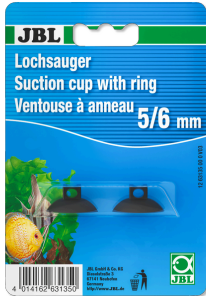
JBL Lochsauger 5/6mm Sauger für Objekte mit 6 mm Durchmesser