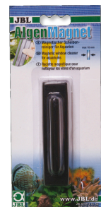
JBL Algenmagnet Scheiben-Reinigungsmagnet für Aquarienscheiben