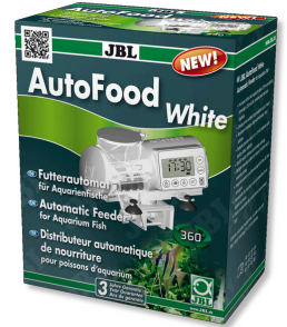
JBL AutoFood WHITE Weißer Futtermat für Aquarienfische