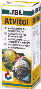
JBL Atvitol Multivitaminropfen für Aquarienfische