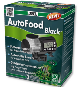
JBL AutoFood BLACK Schwarzer Futterautomat für Aquarienfische