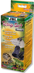
JBL TempSet basic Installation kit for lamps in terrariums