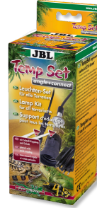
JBL TempSet angle+ connect Installation kit for lamps in terrariums