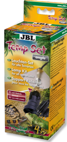
JBL TempSet angle Installation kit for lamps in terrariums