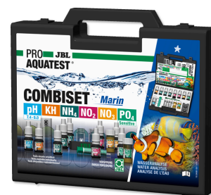
JBL PROAQUATEST COMBISET Marin Чемоданчик с тестами для анализа морской воды