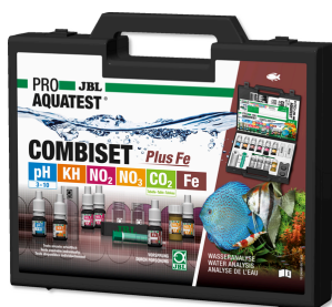
JBL PROAQUATEST COMBISET Plus Fe Чемоданчик с важными тестами для воды + тест Fe