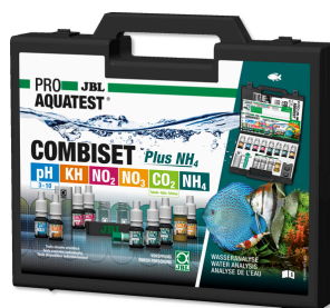
JBL PROAQUATEST COMBISET Plus NH4 Чемоданчик с важными тестами для воды + тест NH4