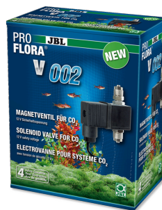
JBL PROFLORA v002 Бесшумный электромагнитный клапан