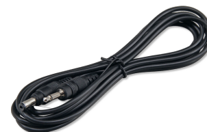
JBL pH-Control Touch соединительный кабель