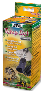
JBL TempSet basic Комплект для установки ламп в террариуме