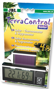
JBL TerraControl Solar Термометр и гигрометр для любых террариумов