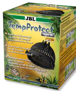
JBL TempProtect light Защита от ожогов у рептилий для JBL TempSet