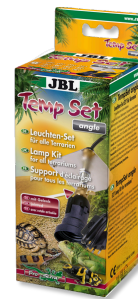
JBL TempSet angle Комплект для установки ламп в террариуме