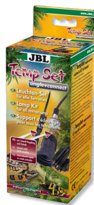
JBL TempSet angle+connect Комплект для установки ламп в террариуме