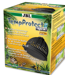
JBL TempProtect II light Защита от ожогов у рептилий для JBL TempSet