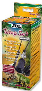
JBL TempSet connect Комплект для установки с разъёмным соединением