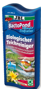
JBL BactoPond Бактерии для самоочистки пруда