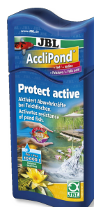
JBL AccliPond Кондиционер для прудовой воды