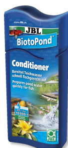
JBL BiotoPond Кондиционер для пруда