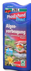
JBL PhosEx Pond Direct Средство для устранения фосфатов из прудовой воды