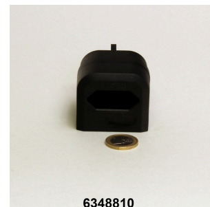
JBL adapter UK for all flat-pin plugs