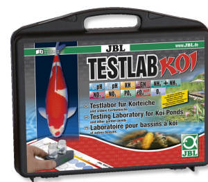
JBL Testlab Koi Чемоданчик с профессиональными тестами для пруда с кои