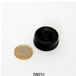
JBL PondOxi Set Membrane