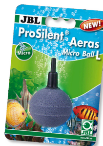
JBL Aeras Micro Ball L Распылитель воздуха для мелких пузырьков