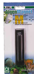
JBL Algae Magnet Магнитный скребок для аквариумных стёкол