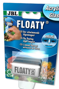
JBL FLOATY Акрил/стекло Плавающий магнитный скребок для акрила