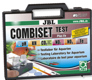
JBL Test Combi Set Plus Fe Чемоданчик с важными тестами для воды + тест Fe