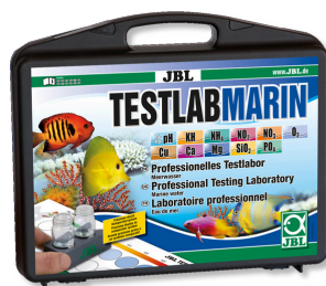
JBL Testlab Marin Чемоданчик с профессиональными тестами морской воды