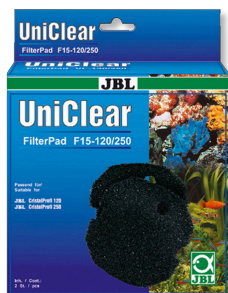
JBL FilterPad F15 Губка грубой фильтрации для CristalProfi