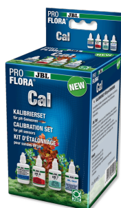
JBL PROFLORA Cal Комплект для калибровки