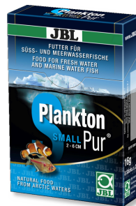
JBL PlanktonPur SMALL Лакомство для небольших аквариумных рыб