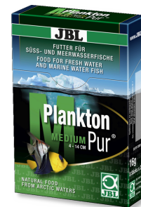
JBL PlanktonPur MEDIUM Лакомство для крупных аквариумных рыб