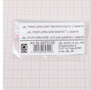
JBL PF CO2 guarnizione piatta per U