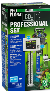
JBL PROFLORA CO2 PROFESSIONAL SET M Impianto di concimazione CO2 con comando