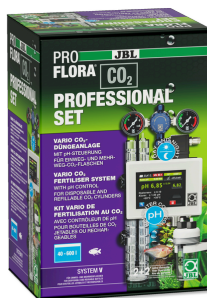
JBL PROFLORA CO2 PROFESSIONAL SET V Impianto di concimazione CO2 con comando/SENZA BOMBOLA