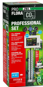
JBL PROFLORA CO2 PROFESSIONAL SET U Impianto di concimazione completo con comando CO2/pH