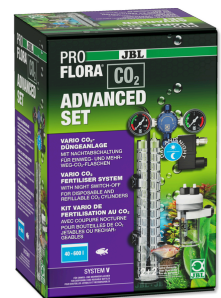
JBL PROFLORA CO2 ADVANCED SET V Impianto di CO2 SENZA BOMBOLA con manometri e valvola