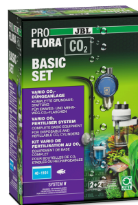
JBL PROFLORA CO2 BASIC SET V Impianto di fertilizzazione con CO2 SENZA BOMBOLA