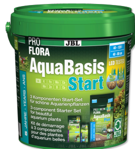
JBL PROFLORA ProFloraStart Kit fertilizzante piante per acquari d'acqua dolce