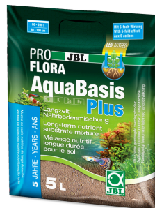
JBL PROFLORA AquaBasis plus Substrato nutriente a lunga durata per acquari