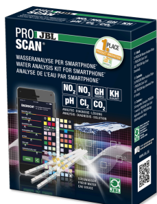
JBL PROSCAN Test dell'acqua con analisi via smartphone