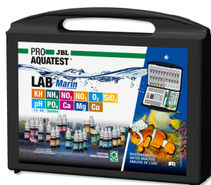
JBL PROAQUATEST LAB Marin Valigetta professionale per analizzare l'acqua marina