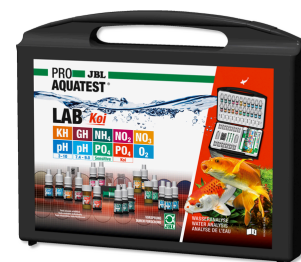
JBL PROAQUATEST Lab Koi Valigetta test professionale per laghetti koi/giardino