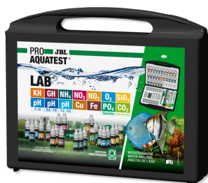
JBL PROAQUATEST LAB Valigetta con 13 test per l'analisi dell'acqua dolce