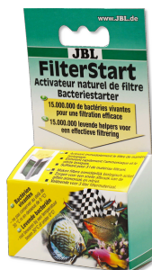
JBL FilterStart Batteri per l'attivazione del filtro