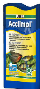
JBL Acclimol Preparazione dell'acqua per un nuovo ambientamento