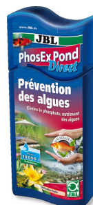
JBL PhosEx Pond Direct Rimovitore di fosfati per laghetti