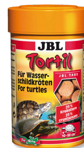
JBL Tortil Mangime in compresse per tartarughe d'acqua e palustri