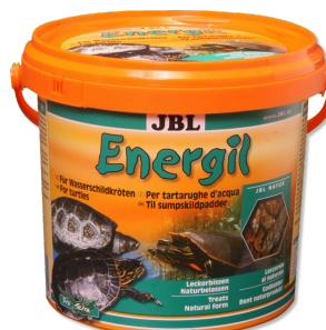
JBL Energil Mangime di base per tartarughe palustri e acquatiche