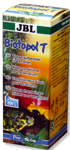
JBL Biotopol T Biocondizionatore per terrari