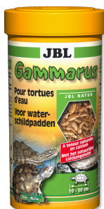
JBL Gammarus Leccornia per tartarughe acquatiche da 10 a 50 cm