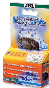
JBL Easy Turtle Granulato speciale per eliminare gli odori