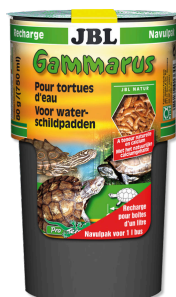
JBL Gammarus, ricarica Leccornia per tartarughe acquatiche da 10 a 50 cm