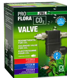
JBL PROFLORA CO2 VALVE Électrovanne de CO2 pour apport de CO2 contrôlé