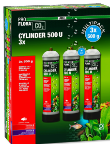
JBL PROFLORA CO2 CYLINDER 500 U 3x Bouteille de CO2 à usage unique, 500 g (pack de 3)