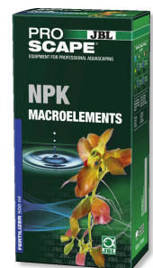
JBL PROSCAPE NPK MACROELEMENTS Engrais végétal à 3 composants pour aquascaping