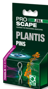
ÉPINGLES JBL PROSCAPE PLANTIS Épingles pour fixation des plantes en aquarium