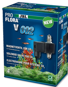
JBL PROFLORA v002 Électrovanne silencieuse