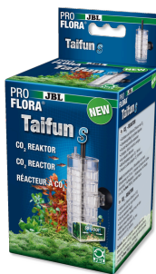
JBL PROFLORA Taifun S Diffuseur de CO2 extensible pour petit aquarium