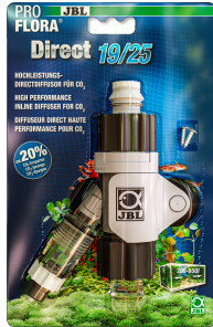
JBL PROFLORA Direct Diffuseur direct de CO2 haute performance