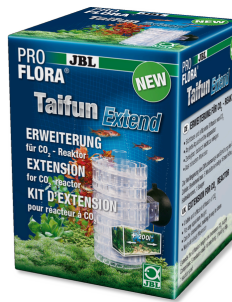
JBL PROFLORA Taifun Extend Extension pour réacteur à CO2 haute diffusion