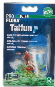
JBL PROFLORA Taifun P Mini-diffuseur de CO2 pour nano-aquarium d'eau douce