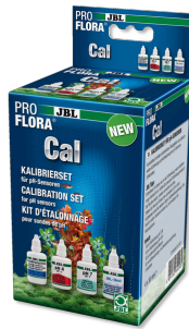
JBL PROFLORA CaI Kit complet d'étalonnage