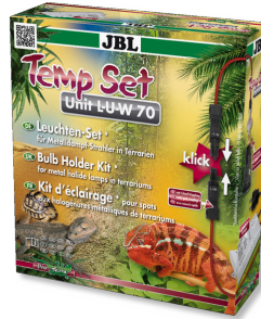
JBL TempSet Unit L-U-W Kit d'installation pour spot à décharge (LUW et HQI)