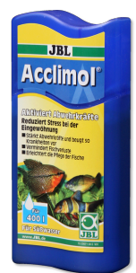
JBL Acclimol Conditionneur d'eau pour l'acclimatation des poissons