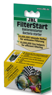
JBL FilterStart Bactéries pour activation des filtres