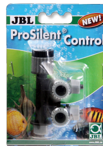
JBL ProSilent Control Robinet à air de précision réglable