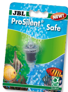
JBL ProSilent Safe Sécurité antiretour