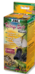
JBL TempSet angle Kit d'installation pour spot de terrarium