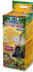
JBL TempSet angle Kit d'installation pour spot de terrarium