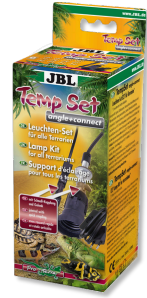
JBL TempSet angle+ connect Kit d'installation pour spot de terrarium