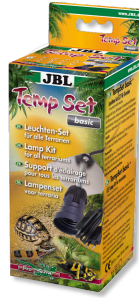
JBL TempSet basic Kit d'installation pour spot de terrarium