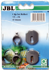
JBL SOLAR REFLECT Kit clips Fixation pour tubes fluorescents