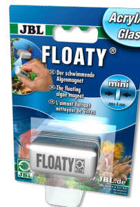
JBL FLOATY Verre/Acrylique Aimant flottant nettoyeur de vitres acryliques