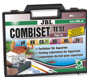
JBL Kit Combiset Test Plus Fe Coffret avec les principaux tests d'eau + test fer