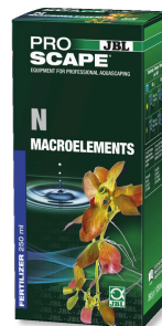
JBL PROSCAPE N MACROELEMENTS Engrais végétal à l'azote pour aquascaping