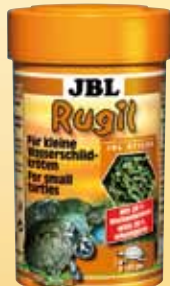
JBL Rugil Bastoncini di mangime per piccole tartarughe palustri e d'acqua