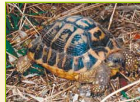
Testudo hermanni hermanni