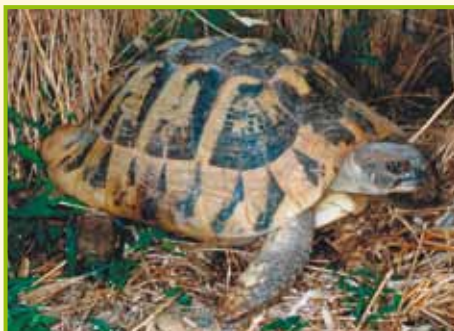
Testudo hermanni boettgeri