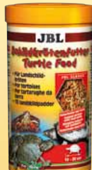
JBL Mangime per tartarughe Mangime principale per tutte le tartarughe palustri e d'acqua