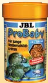
JBL ProBaby Mangime speciale per giovani tartarughe palustri e d'acqua