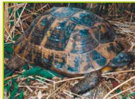
Testudo graeca iberia