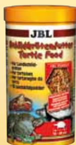
JBL Mangime per tartarughe Mangime princi- pale per tutte le tartarughe d'acqua