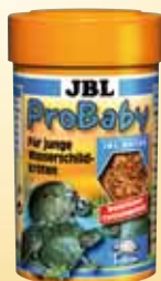
JBL ProBaby Mangime speciale per giovani tar- tarughe d'acqua