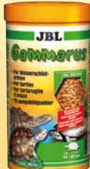
JBL Gammarus Gammarus purificati, mangime principale per tutte le tartarughe palustri e d'acqua