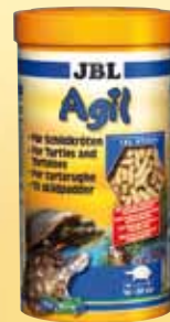
JBL Agil Bastoncini di mangime per tartarughe