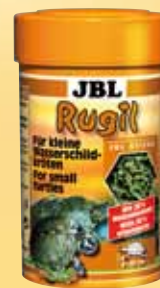
JBL Rugil Bastoncini di mangime per tartarughe palustri e d'acqua