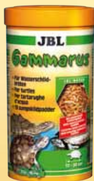
JBL Gammarus Gammarus purificati, mangime principale per tutte le tartarughe palustri e d'acqua