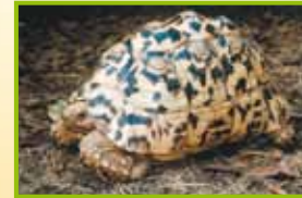
Geochelone pardalis babcocki