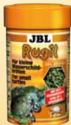
JBL Rugil Bastoncini di man- gime per piccole tartarughe d'acqua