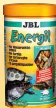
JBL Energil Leccornia di pesce e granchi