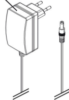
JBL ProTemp Cooler x200/x300 Fuente alimentación