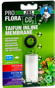
JBL PROFLORA CO2 TAIFUN INLINE MEMBRANE

Membrana de repuesto para difusor de CO2 TAIFUN INLINE