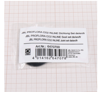
Juego de juntas JBL PF CO2 INLINE