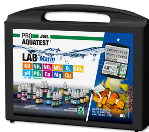
JBL PROAQUATEST LAB Marin Maletín tests profesional para analizar el agua salada