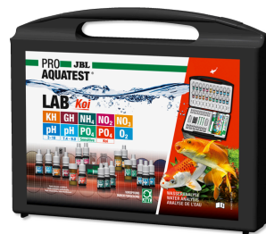
JBL PROAQUATEST LAB Koi Maletín de tests profes. p. estanques de kois/jardín