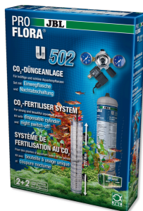
JBL PROFLORA u502 Sist. fertilizante plantas con sist. apagado nocturno