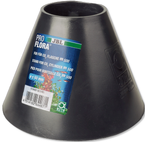
JBL PROFLORA Base para bombona de CO2 de 500 g

Base para bombonas de sistemas fertilizantes de CO2