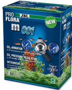
JBL PROFLORA m001 Válvula para regular la presión

Base para bombonas de sistemas fertilizantes de CO2