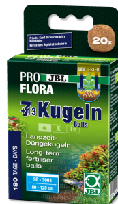
JBL PROFLORA 7 + 13 bolas Estimulador de raíces para acuarios de agua dulce