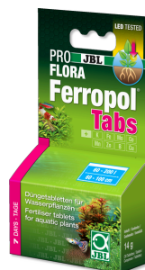
JBL PROFLORA Ferropol Tabs

Fertiliz. diario para plantas de acuario de agua dulce