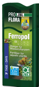
JBL PROFLORA Ferropol

Fertilizante para plantas para acuarios de agua dulce