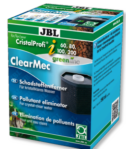
JBL ClearMec CristalProfi i60/80/100/200 Eliminador de nitritos, nitratos y fosfatos para CPI